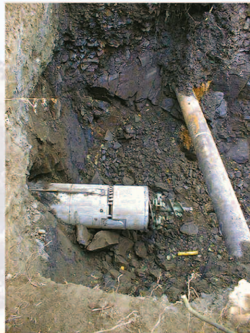
Zielbaugrube / Receiving pit / Fouille de but