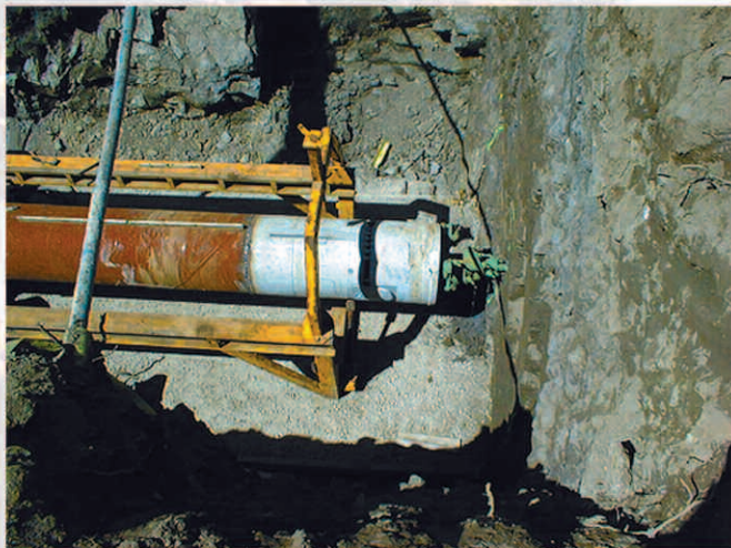
Start baugrube / Starting pit / Fouille de départ

La trousse coupante est un sabot tranchant – réglable en hauteur – pour des tubes d'aciers. Elle est commandée via des flexibles hydrauliques. Un clinomètre sert pour la navigation. Dépendent des caractères du sol, des têtes de forage différentes peuvent être utilisées. La tarière guide est équipée avec un joint à rotule par lequel la correction de l'inclinaison peut se faire facilement.